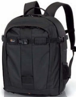
Pro Runner™ 300 AW