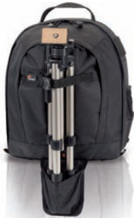
Pro Runner™ 200 AW