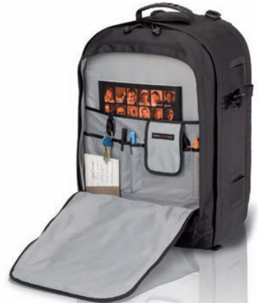
Pro Runner™ 450 AW

Die Pro Runner™ AW Serie besteht aus robusten Reiserucksäcken für eine DSLR-Ausrüstung. Mit dem klaren, kompakten Design eignen sie sich ideal für Fotojournalisten und Hobbyfotografen, die Ihre Kameraausrüstung mit Stativ, Zubehör und persönlichen Dingen bequem verstauen möchten. Aufgrund des geringen Gewichts eignen sie sich ideal für Städtetouren oder leichte Wanderungen.